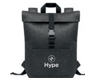
Indico Pack MO6456

Organizador de viaje de fieltro RPET con 2 compartimentos interiores y 4 exteriores.