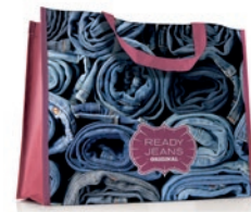
MO4070 Bolsa de compra horizontal con asas largas del mismo material o asas en PP webbing.