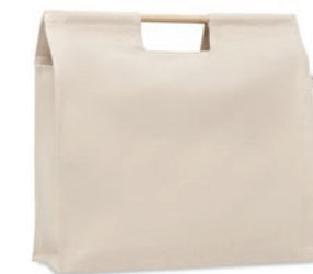
Mercado Top MO6458

Bolsa de la compra de algodón orgánico con asas largas. 140 gr/m 2 . Producido bajo certificado estándar para controlar el uso de sustancias nocivas en textil.