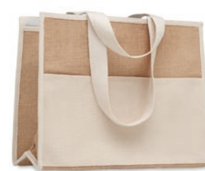
Campo De Geli MO6160

Bolsa de la compra en canvas y yute con interior laminado, con cierre de velcro, frontal con bolsillo de canvas y asas largas de algodón.