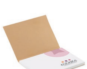
SNES50 SNES50 Notas adhesivas de papel reciclado de tapa blanda.