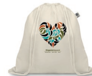
Organic Hundred MO8974

Bolsa de cuerdas de algodón orgánico. 140 gr/m 2 . Fabricada con algodón orgánico certificado.