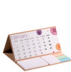
CALECO CALECO CalendoNote de papel reciclado de tapa dura.