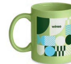
Dublin Tone MO6208

Taza de cerámica de 300 ml de capacidad. Presentado en una caja de regalo de cartón individual.