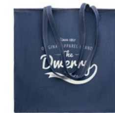
Style Tote MO6420

Bolsa de cuerdas denim 50% algodón reciclado y 50% algodón. 250 gr/m 2 .