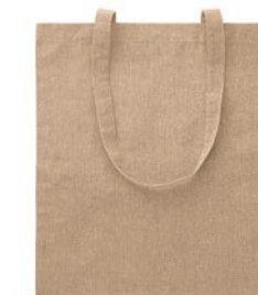
Cottonel Duo MO9424

Bolsa de la compra denim de 50% algodón reciclado y 50% algodón con asas largas. 250 gr/m 2 .