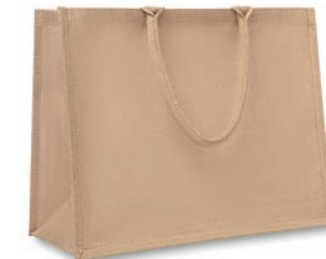
Brick Lane MO8965

Bolsa de la compra o de la playa laminada de yute con asas cortas de algodón.