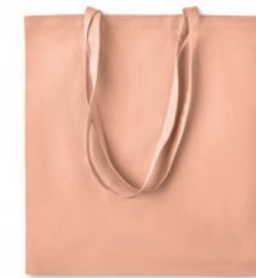
Zimde Colour MO6189

Bolsa de la compra de algodón orgánico con asas largas. 140 gr/m 2 . Hecho de algodón orgánico producido bajo etiqueta certificada.