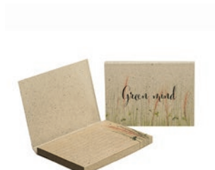
SNGG50 SNGG50 Tapa flexible de papel de hierba con notas adhesivas de papel de hierba.