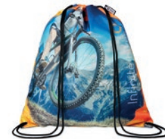
MB3111 Bolsa de cordones de PET reciclado.