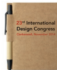
Cartopad MO7626 Libreta de bolsillo en material reciclado y 80 hojas. Incluye pequeño bolígrafo con tinta azul