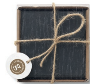
Slate4 MO9124 Set de 4 posavazos de pizarra y base de EVA.