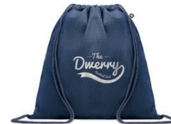
Style Bag MO6422

Bolsa de la compra jaspeada de algodón y poliéster reciclado con cuerdas y asas largas. 140 gr/m 2 . Este artículo puede encogerse después de imprimir.