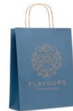
Paper Tone M MO6173

Libreta con tapa de cartón (250gr/m 2 ) A6 de 40 hojas de papel reciclado de 70 gr.