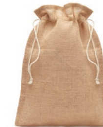
Jute Medium MO9929

Bolsa grande para regalo de cuerdas de yute. Tamaño aprox. 30 x 47 cm.