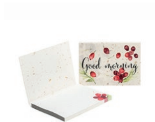
SNCS50 SNCS50 Tapa flexible de papel de café con notas adhesivas de papel reciclado.