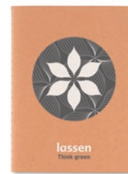
Mini Paper Book MO9868

Libreta con tapa de cartón (250gr/m 2 ) A5 de 40 hojas de papel reciclado de 70 gr.