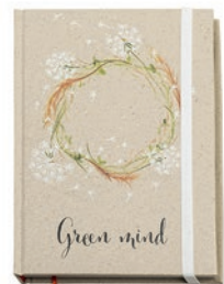
NOTE5 NOTE5 Libreta A5 con tapa rígida de papel reciclado que contiene fibras de hierba.