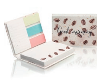
COMBC1 COMBC1 Libreta A5 con tapa flexible de papel reciclado que contiene trazas de café.