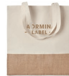
India Tote MO9518

Bolsa de la compra en canvas y yute con interior laminado, con cierre de velcro, frontal con bolsillo de canvas y asas largas de algodón.