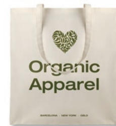
Organic Cottonel MO8973

Bolsa de la compra de algodón orgánico con asas largas. 105 gr/m 2 . Producido bajo certificado estándar para controlar el uso de sustancias nocivas en textil.