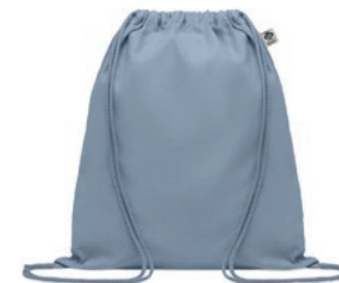
Yuki Colour MO6355

Envoltorio reutilizable de tamaño mediano de algodón orgánico para guardar alimentos. 140 gr/m 2 .