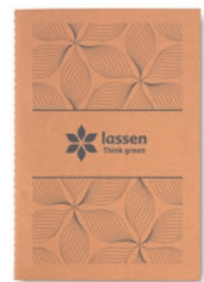
Mid Paper Book MO9867

Libreta con tapa de cartón (250gr/m 2 ) A5 de 40 hojas de papel reciclado de 70 gr.