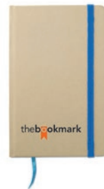
Evernote MO7431 Libreta A6 de material reciclado con 96 hojas blancas con marca páginas de color y banda elástica a juego.