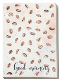
NOPCC5 NOPCC5 Libreta A5 con tapa flexible de papel reciclado que contiene trazas de café.