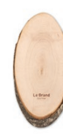
Tabla de madera con corteza en forma ovalada de tamaño mediano y fabricada en la UE de madera Adler. Hecho de 1 trozo de madera. La medida puede variar de una unidad a otra.