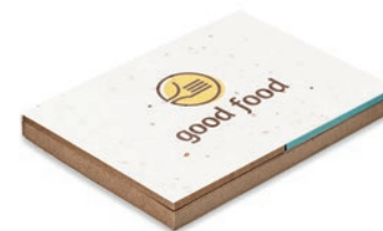
Grow Me MO6235

Libreta de notas con tapa de bambú y 70 hojas de papel reciclado. Incluye un bolígrafo de bambú a juego con punta y clip de ABS.