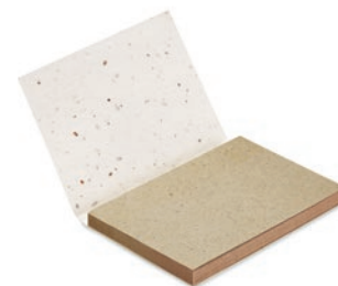
Grow Me MO6234

Bloc de notas de 25 hojas de papel de hierba y 3 stickers de color. Después de su uso, una selección de semillas de flores silvestres crecerá al plantar la cubierta en el suelo. Fabricado en la UE.