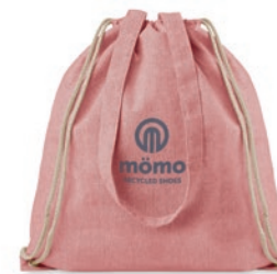
Moira Duo MO9603

Bolsa de la compra jaspeada de algodón y poliéster reciclado con cuerdas y asas largas. 140 gr/m 2 . Este artículo puede encogerse después de imprimir.