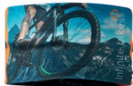
MH3101 MH3101 Cinta para la cabeza unisex y a todo color, hecha de PET reciclado y elástico.