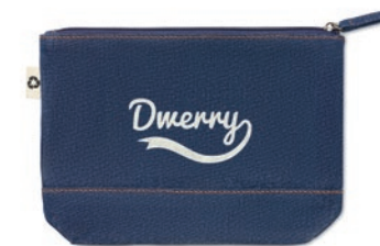
Style Pouch MO6421

Bolsa de la compra jaspeada de algodón y poliéster reciclado con asas largas. 140 g/m 2 . Este artículo puede encogerse después de imprimir.