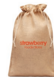
Jute Large MO9930

Bolsa de la compra realizada en yute con asas de algodón.