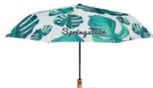
MU2006 MU2006 Paraguas plegable a 3 tiempos de 21" con mango de madera.