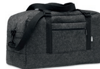
Indico Bag MO6457

Bolsa de cuerdas de fieltro RPET con cuerdas de poliéster.