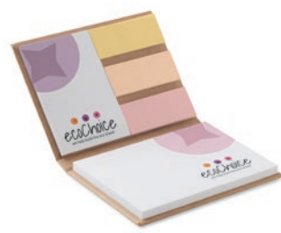
COMBE1 COMBE1 ComboNote de papel reciclado de tapa dura.